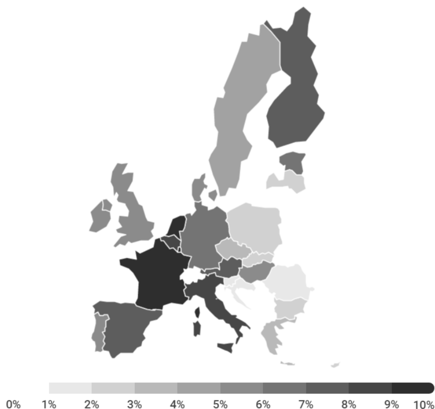
Carte 7.1. Emplois rémunérés dans l'économie sociale par rapport au volume total de l'emploi rémunéré dans chaque pays européen en pourcentage, en 2015

Le panorama varie selon les pays membres de l'Union. Tandis que l'emploi dans l'économie sociale représente entre 9 et 10 % de la population active dans des pays comme la Belgique, la France, l'Italie, le Luxembourg et les Pays-Bas, dans les nouveaux États membres de l'Union tels que Chypre, la Croatie, la Lituanie, Malte, la Roumanie, la Slovaquie et la Slovénie, l'économie sociale reste un secteur émergent de taille réduite qui emploie moins de 2 % de la population active.